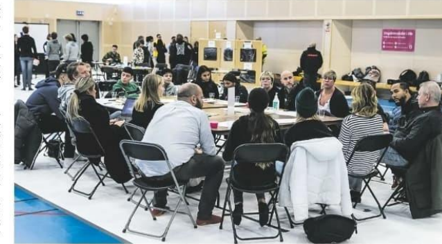
Det var fem olika stationer där olika ämnen diskuterades under årets Påverkanstor,